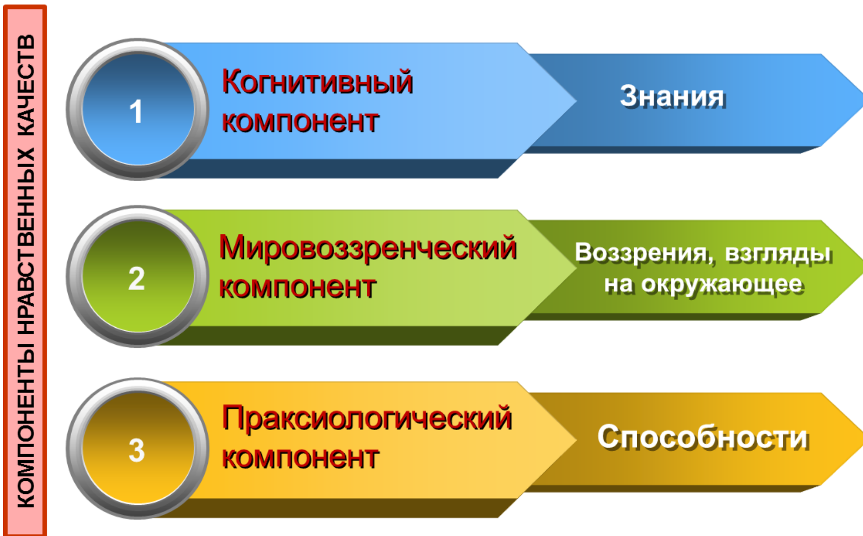
Рис. 2. Модель формирования нравственных качеств старшеклассников.